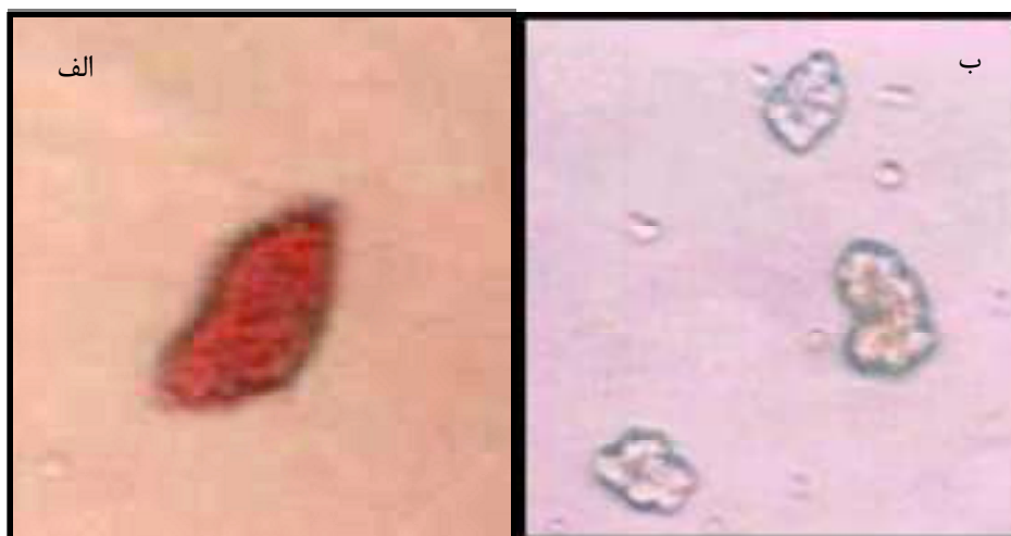
شکل ۱- جزایر لانگرهانس که توسط رنگ دیتیزون رنگ‌آمیزی شده‌اند. الف) جزیره لانگرهانس در جنین ۱۹/۵ روزه‌ی موش ب) جزایر لانگرهانس در نوزاد یک روزه‌ی موش. بزرگنمایی: ۲۰X

به منظور تشخیص بافت جزایر لانگرهانس پانکراس در جنین ۱۹/۵ روزه و نوزاد یک روزه، جداسازی جزایر