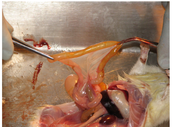
شکل 1c: موش ماده از گروهی که متیل پردنیزولون و پیوگلیتازون با هم گرفته‌اند.