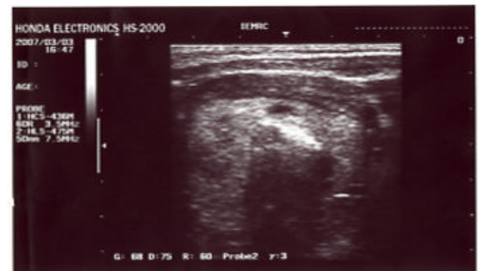
تصویر ۳- نکروز کواگولاتیو در اثر لیزر