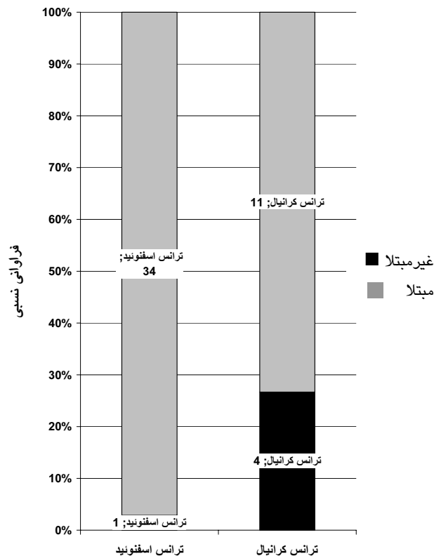
نمودار ۲- فراوانی بروز دیابت بی‌مزه‌ی تأخیری به دنبال روش جراحی ترانس کرانیال و ترانس اسفنوئید

با توجه به اینکه از ۱۵ بیمار مبتلا به DI، ۵ نفر (یک سوم بیماران) بدون استفاده از Minirin بهبود یافتند و از ۱۰ نفری که از Minirin استفاده کرده بودند، ۵ نفر تنها یک روز (میانگین روزانه ۳ میکروگرم) به Minirin نیاز داشتند، می‌توان چنین نتیجه‌گیری کرد که پزشکان باید در موارد بروز DI پس از آدنکتومی، تا حد امکان از تجویز Minirin