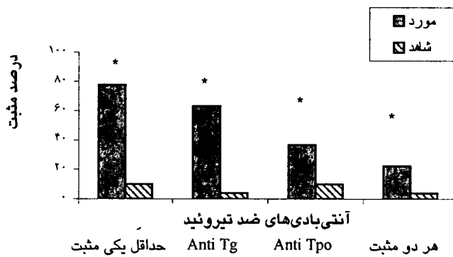
نمودار ۱- مقایسه درصد تیتراژ مثبت اتو آنتی‌بادی‌ها بین گروه شاهد و مورد ( p < 0.01 )