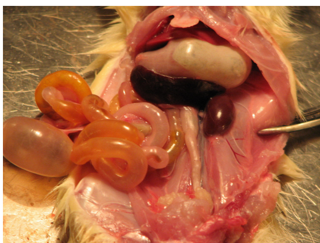
شکل 1d: موش نر از گروهی که متیل پردنیزولون و پیوگلیتازون با هم گرفته‌اند.