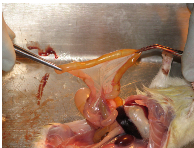
شکل 1c: موش ماده از گروهی که متیل پردنیزولون و پیوگلیتازون با هم گرفته‌اند.