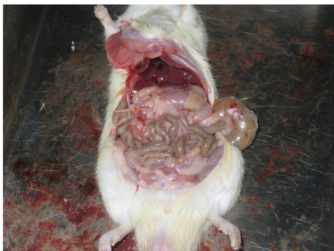
شکل 1b: موش نر از گروهی که متیل پردنیزولون به تنهایی گرفته‌اند.

گروه ۱: گروهی که گلوکوکورتیکوئید و پیوگلیتازون مصرف می‌کردند؛ گروه ۲: گروهی که فقط گلوکوکورتیکوئید مصرف می‌کردند. * اعداد به صورت میانگین ± انحراف معیار نشان داده شده‌اند، † N.S: اختلاف غیر معنی‌داری بود.