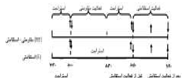
شکل ۱- طرح تحقیق: (↓ نمونه‌گیری خونی، آجمع‌آوری گازهای تنفسی).

چربی سه ناحیه‌ی سینه، شکم، ران و تعیین بیشینه اکسیژن مصرفی (VO 2 max) روی دوچرخه‌ی ارگومتر در آزمایشگاه حضور یافتند. برای جلوگیری از تاثیر فعالیت وامانده‌ساز VO 2 max روی عملکرد در تعیین قدرت یک تکرار بیشینه، تمام آزمودنی‌ها بعد از یک هفته، یک جلسه‌ی دیگر نیز برای تعیین یک تکرار بیشینه (IRM) به آزمایشگاه مراجعه کردند. دو روز قبل از فعالیت از خوردن کافئین، الکل، مکمل‌های ورزشی و همچنین فعالیت شدید منع شدند. سپس به فاصله‌ی یک هفته، دو جلسه‌ی دیگر بعد از ۱۲-۱۰ ساعت حالت ناشتا، ساعت ۷:۳۰ صبح برای انجام فعالیت ورزشی تعیین شده در آزمایشگاه حضور یافتند. تمام آزمودنی‌ها هر دو فعالیت را به طور تصادفی و به صورت متقاطع با فاصله‌ی یک هفته انجام دادند. برای جلوگیری از تغییرات روزانه‌ی هورمون‌ها، فعالیت استقامتی در هر دو گروه در یک ساعت مشابه انجام شد. قبل از فعالیت برای اطمینان از ناشتا بودن و نداشتن دیابت، از تمام آزمودنی‌ها آزمون قند خون با استفاده از گلوکومتر (ACCU-CHEK ACTIVE - آلمان) گرفته شد. در جلسه‌ی اول که شامل فعالیت مقاومتی-استقامتی (RE) i بود، آزمودنی‌ها پس از ۳۰ دقیقه استراحت، فعالیت مقاومتی دایره‌ای (۳ نوبت با ۱۴ تکرار در ۵۰٪ یک تکرار بیشینه و ۳۰ ثانیه استراحت بین هر ایستگاه و ۲ دقیقه استراحت بین هر نوبت برای ۶ ایستگاه) ۱۲،۱۳ را انجام دادند. کل زمان فعالیت مقاومتی دایره‌ای ۲۱ دقیقه طول کشید و بعد از ۲۰ دقیقه استراحت پس از فعالیت مقاومتی دایره‌ای، ۳۰ دقیقه فعالیت استقامتی با شدت ۶۰٪ VO 2 max روی دوچرخه‌ی ارگومتر انجام دادند (شکل ۱).