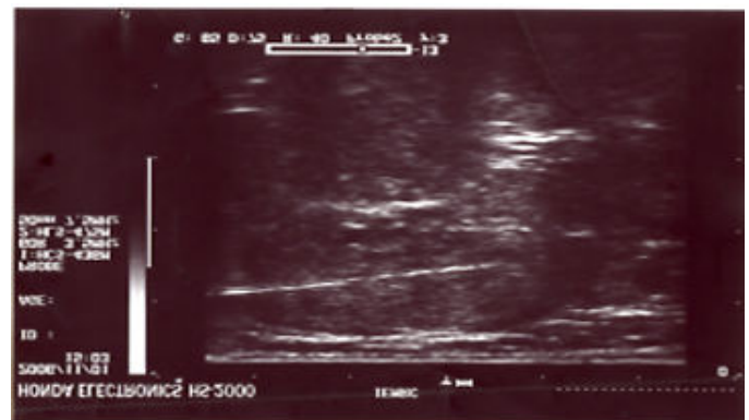
تصویر ۲- مشاهده‌ی سونوگرافی ورود سوزن نخاعی در مرکز گره