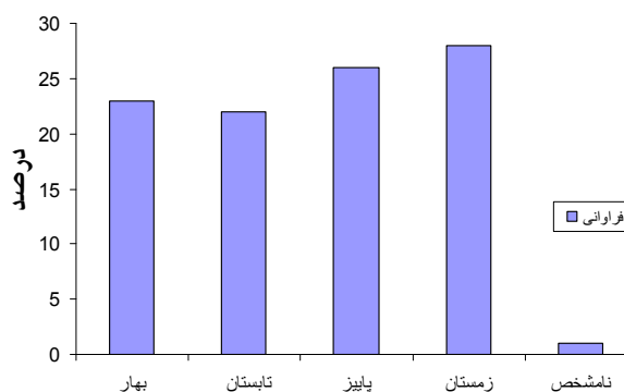
نمودار ۱- فراوانی شکستگی‌های قابل انتساب به استئوپروز به تفکیک فصل وقوع شکستگی

از همه‌ی ۴۹۰ مورد بیمار با شکستگی هیپ، ۱۴۶ مورد (۲۹/۸٪) از شکستگی‌ها متناسب با تروما و ۳۲۷ مورد (۶۸/۸٪) نامتناسب با تروما (ناشی از زمین خوردن یا قابل انتساب به استئوپروز) بود. در ۷ مورد علت شکستگی در پرونده ذکر نشده بود. از شکستگی‌های استئوپروتیک، ۱۴۲ مورد (۴۲/۱٪) در زنان و ۱۹۵ مورد (۵۷/۹٪) در مردان رخ داده بود که اغلب ساکن شهر بودند. (۶۱/۱٪ ساکن شهر و ۲۸/۹٪ ساکن روستا). ۲۷٪ شکستگی‌های استئوپروتیک در فصل زمستان رخ داده بود ولی از نظر فصل وقوع شکستگی تفاوت معنی‌داری بین فصول مشاهده نشد (نمودار ۱).