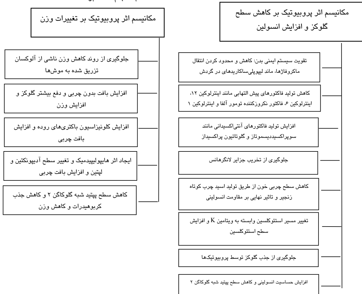
شکل ۲- خلاصه مکانیسم کلی اثر پروبیوتیک بر هموستاز گلوکز و انسولین، و تغییرات وزن

پژوهش حاضر، براساس تحقیقات انجام شده، تنها مطالعه‌ی مروری ساختاریافته است که تمام مطالعات مربوط به مداخله‌ی پروبیوتیک‌ها را به طور ساختاریافته مورد بررسی قرار داده است، به طوری که از ورود دیگر مطالعات غیر مرتبطی که در مطالعات مشابه استفاده شده بودند، جلوگیری کرده تا مقایسه‌ی دقیق‌تری بین بررسی‌ها انجام شود. در پژوهش حاضر، هر یک از شاخص‌های آزمایشگاهی مورد بحث در بخش‌های جدا دسته‌بندی شدند و جزییات روش کار مقالات حیوانی و انسانی اعم از دوز و نوع سویه‌های باکتری، و مدت زمان مورد مداخله به طور جداگانه در هر بخش مورد بررسی قرار گرفتند، که در مقالات مشابه انجام نشده بود.