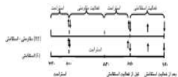
شکل ۱- طرح تحقیق: ↓ نمونه‌گیری خونی، آجمع‌آوری گازهای تنفسی.

چربی سه ناحیه‌ی سینه، شکم، ران و تعیین بیشینه اکسیژن مصرفی (VO 2 max) روی دوچرخه‌ی ارگومتر در آزمایشگاه حضور یافتند. برای جلوگیری از تاثیر فعالیت وامانده‌ساز VO 2 max روی عملکرد در تعیین قدرت یک تکرار بیشینه، تمام آزمودنی‌ها بعد از یک هفته، یک جلسه‌ی دیگر نیز برای تعیین یک تکرار بیشینه (IRM) به آزمایشگاه مراجعه کردند. دو روز قبل از فعالیت از خوردن کافئین، الکل، مکمل‌های ورزشی و همچنین فعالیت شدید منع شدند. سپس به فاصله‌ی یک هفته، دو جلسه‌ی دیگر بعد از ۱۲-۱۰ ساعت حالت ناشتا، ساعت ۷:۳۰ صبح برای انجام فعالیت ورزشی تعیین شده در آزمایشگاه حضور یافتند. تمام آزمودنی‌ها هر دو فعالیت را به طور تصادفی و به صورت متقاطع با فاصله‌ی یک هفته انجام دادند. برای جلوگیری از تغییرات روزانه‌ی هورمون‌ها، فعالیت استقامتی در هر دو گروه در یک ساعت مشابه انجام شد. قبل از فعالیت برای اطمینان از ناشتا بودن و نداشتن دیابت، از تمام آزمودنی‌ها آزمون قند خون با استفاده از گلوکومتر (ACCU-CHEK ACTIVE - آلمان) گرفته شد. در جلسه‌ی اول که شامل فعالیت مقاومتی-استقامتی (RE) i بود، آزمودنی‌ها پس از ۳۰ دقیقه استراحت، فعالیت مقاومتی دایره‌ای (۳ نوبت با ۱۴ تکرار در ۵۰٪ یک تکرار بیشینه و ۳۰ ثانیه استراحت بین هر ایستگاه و ۲ دقیقه استراحت بین هر نوبت برای ۶ ایستگاه) ۱۲،۱۳ را انجام دادند. کل زمان فعالیت مقاومتی دایره‌ای ۲۱ دقیقه طول کشید و بعد از ۲۰ دقیقه استراحت پس از فعالیت مقاومتی دایره‌ای، ۳۰ دقیقه فعالیت استقامتی با شدت ۶۰٪ VO 2 max روی دوچرخه‌ی ارگومتر انجام دادند (شکل ۱).