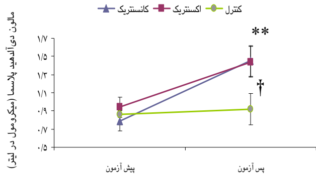
نمودار ۳- مقایسه‌ی تغییرات مالون دی آلدئید (MDA) پلاسمای گروه‌های کنترل، کانسنتریک، و اکسنتریک در گذر زمان. ** اثر معنی‌دار گذر زمان در سطح P \leq 0.001 † اثر متقابل معنی‌دار گذر زمان و گروه در سطح P \leq 0.05 .

اما این یافته‌ها با یافته‌های پژوهش‌های زیر در تضاد می‌باشد: گوئیل و همکاران (۱۹۸۶) دریافتند فعالیت زیر بیشینه‌ی طولانی مدت منجر به کاهش GSH پلاسمای خون شد، ۲۳ این یافته مشابه پژوهش لیرز و همکاران ۲۴ بود، آنها بیان نمودند کاهش GSH پلاسما بعد از تمرین می‌تواند ناشی از مصرف آن توسط عضلات اسکلتی باشد که موجب کاهش خروج GSH از عضله به پلاسما می‌شود. همچنین در پژوهشی که لی جی و همکاران (۲۰۰۲) انجام دادند، دریافتند فعالیت اکسنتریک آرنج موجب تغییر معنی‌داری در GSH خون مردان جوان پس از فعالیت نسبت به قبل از آن نشد. ۲۵ عوامل احتمالی درباره‌ی سازوکار افزایش GSH بعد از فعالیت اکسنتریک و کانسنتریک به شرح ذیل می‌باشد: یکی از این سازوکارها میزان فعالیت گلویتاتیون ردوکتاز بلافاصله